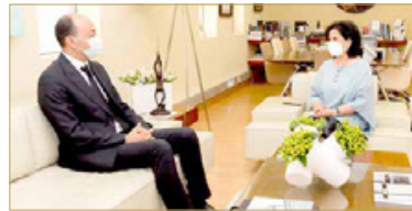
المنامة - هيئة البحرين للثقافة والآثار

استقبلت رئيسة هيئة البحرين للثقافة والآثار الشيخة مي بنت محمد آل خليفة في مكتبها أمس سفير الجمهورية التونسية الجديد لدى مملكة البحرين كمال القيزاني، حيث تبحثان الطرفان سبل تعزيز العلاقات الثقافية بين البلدين الشقيقين.