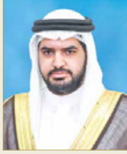
سمو الشيخ عيسى بن علي

♦ التوجيهات الملكية ومتابعة سمو ولي العهد رئيس الوزراء وراء نجاح التصدي للفيروس