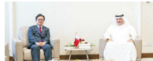
المستشار راشد بونجمة يستقبل السفير الكوري.

استقبل المستشار راشد محمد بونجمة الأمين العام لمجلس النواب، بمكتبه أمس، هاي كوان تشونغ سفير جمهورية كوريا المعين لدى مملكة البحرين وخلال اللقاء رحب الأمين العام لمجلس النواب بالسفير الكوري، مشيداً بالعلاقات الثنائية المتميزة بين مملكة البحرين وجمهورية كوريا الصديقة، التي تمتد أكثر من أربعة عقود، وما تحظى به من رعاية واهتمام من حضرة صاحب الجلالة الملك المفدى، مشيراً إلى حرص رئيسة مجلس النواب فوزية بنت عبدالله زينل على تعزيز العلاقات البرلمانية المشتركة، على مستوى المجلسين والأمانة العامة، وتنسيق المواقف في المحافل الإقليمية والدولية، ودعم القضايا المشتركة. وجري تنظيم هذا المنتدى من قبل المنتدى من قبل مركز بي بي دي وشركائه، أعرب أربعمون كورية عن تطور ونماء على مختلف المستويات، وخاصة في المجال البرلماني، معبرا عن تطلع بلاده إلى الارتقاء بالعلاقات الوافية بما يحقق مصالح البلدين والشعبين الصديقين.