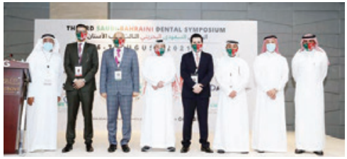
جانب من المشاركين في المنتدى.

استقبل المستشار راشد محمد بونجمة الأمين العام لمجلس النواب، بمكتبه أمس، هاي كوان تشونغ سفير جمهورية كوريا المعين لدى مملكة البحرين وخلال اللقاء رحب الأمين العام لمجلس النواب بالسفير الكوري، مشيداً بالعلاقات الثنائية المتميزة بين مملكة البحرين وجمهورية كوريا الصديقة، التي تمتد أكثر من أربعة عقود، وما تحظى به من رعاية واهتمام من حضرة صاحب الجلالة الملك المفدى، مشيراً إلى حرص رئيسة مجلس النواب فوزية بنت عبدالله زينل على تعزيز العلاقات البرلمانية المشتركة، على مستوى المجلسين والأمانة العامة، وتنسيق المواقف في المحافل الإقليمية والدولية، ودعم القضايا المشتركة. وجري تنظيم هذا المنتدى من قبل المنتدى من قبل مركز بي بي دي وشركائه، أعرب أربعمون كورية عن تطور ونماء على مختلف المستويات، وخاصة في المجال البرلماني، معبرا عن تطلع بلاده إلى الارتقاء بالعلاقات الوافية بما يحقق مصالح البلدين والشعبين الصديقين.