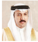
د. الشيخ عبدالله بن أحمد.

وإدوارها» بالإضافة إلى إصدار جلالته المرسوم الملكي لإنشاء الهيئة الوطنية لعلوم الفضاء في عام ٢٠١٤م، التي تستهدف وضع مملكة البحرين في المسار العالمي في هذا المجال، فضلاً عن تأسيس المركز الوطني للأمن السيبراني؛ وجميعها مؤشرات تعكس ماضي مملكة البحرين قديماً في الاستفادة من الثورة التكنولوجية السلمية والصراعات، وضم ثلاث دراسات؛ الأولى: أعدها الدكتور عمر أحمد العبيدي بعنوان: «توظيف التكنولوجيا في المعاملات المالية الحديثة: مبادئ عامة