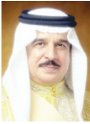
عاهل البلاد المغددي

جرى اتصال هاتفي مساء أمس، بين حضرة صاحب الجلالة الملك حمد بن عيسى آل خليفة عاهل البلاد المغددي حفظه الله ورعاه، وأخيه فخامة الرئيس قيس بن سعيد رئيس الجمهورية التونسية الشقيقة. واستعرض جلالته الملك المغددي مع الرئيس التونسي العلاقات الأخوية الوثيقة وسبل تعزيزها وتنميتها في مختلف المجالات التي تخدم المصالح المشتركة للمبلدين والشعبين الشقيقين. وأعرب جلالته عن أصدق تمنياته للجمهورية التونسية وشعبها الشقيق بدوام التقدم والازدهار والنماء والأمن والاستقرار بقيادة فخامة الرئيس قيس بن سعيد. من جانبه، أعرب الرئيس التونسي عن شكره وتقديره لجلالة الملك المغددي على جهود جلالته في تطوير العلاقات الثنائية المتميزة بين البلدين الشقيقين، متمنياً لشعب مملكة البحرين المزيد من الرفعة والرخاء والتطور تحت قيادة جلالته الحكيمة.