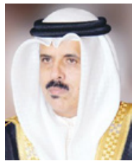
وزير التربية والتعليم

العالمية الرقمية، ومنها: كتابة الصواد التفاعلية وإدارة التعليم عن بعد، وأهداف التنمية المستدامة 2030، وإعداد مواد التدريب عن بعد، والإندوجرافيك وأساسيات التصميم، والبرلات المعرفية عبر الويب، وتحقيقات الحوسبة السحابية في التعليم، وتصميم ونشر الكتاب الإلكتروني، والتدريب على دليل معايير إنتاج المحتوى التعليمي الرقمي، والتأسيس التربوي، والبناء التربوي، وتحليل وعرض البيانات باستخدام النظم الرقمية، والموارد التعليمية المفتوحة. وأكد الوزير أنه منذ تأسيس المركز الإقليمي لتكنولوجيا المعلومات والاتصال من الفئة الثانية على