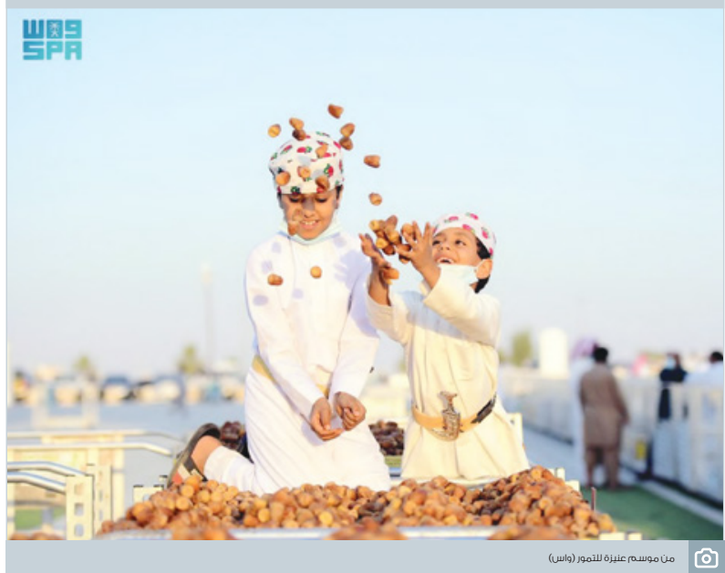
من موسم عنيزة للتمر