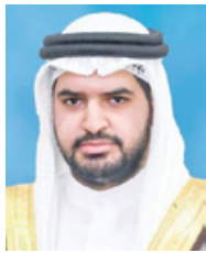
سمو الشيخ عيسى بن علي آل خليفة

الأزمات والطوارئ، ونوه سموه إلى أن الكوادر الوطنية الموجودة في الصقوف الأمامية قدمت أروع الأمثلة في التقاضي والإخلاص للوطن، وأن تكريمها هو رسالة اعتراف وتقدير وشكر لها على جهودها وبصماتها الإنسانية التي نالت احترام الشعب البحريني، والتي جددت التأكيد على مدى أصالة شعب البحرين وما يتحلى به من حس المسؤولية الوطنية. وقال سمو الشيخ عيسى بن علي آل خليفة: «إن أزمة جائحة كورونا (كوفيد-19) رغم قسوتها إلا أنها أظهرت جانباً مهماً في شخصية أبناء البحرين وهو العبادرة إلى التطوع والعمل الإنساني دون الالتفات لحجم المخاطر، فكانت التناضح باهرة وحجم الإنجاز في مواجهة الجائحة عظيماً، ومن واجبتنا أن