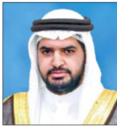
سمو الشيخ عيسى بن علي آل خليفة

الانضمام لفرق التطوع في مختلف الأوجه والواقع الرسمية والأهلية والتجارية، مؤكداً سموه أن جهودهم كانت عنصراً داعماً لفريق البحرين الوطني، وساعدت في ضمان تنفيذ الإجراءات والاشتراطات والتدابير الاحترازية التي يتم تطبيقها لحماحة الجائحة. وأشار سموه إلى أهمية العمل على غرس قيم العمل التطوعي في نفوس الشباب خلفه على أن تاريخ العمل التطوعي في مملكة البحرين طويل وممتد ويعس العنق الحضاري للمملكة، وبعد ركيزة أساسية لنهضة المجتمع ودعم مسيرة التنمية الشاملة التي تشهدها البلاد في ظل القيادة الحكيمة لجلالة الملك المفدى، حفظه الله ورعاه. وأشار سموه إلى أهمية العمل على غرس قيم العمل التطوعي في نفوس الشباب خلفه على أن تاريخ العمل التطوعي في مملكة البحرين طويل وممتد ويعس العنق الحضاري للمملكة، وبعد ركيزة أساسية لنهضة المجتمع ودعم مسيرة التنمية الشاملة التي تشهدها البلاد في ظل القيادة الحكيمة لجلالة الملك المفدى، حفظه الله ورعاه. وأشار سموه إلى أهمية العمل على غرس قيم العمل التطوعي في نفوس الشباب خلفه على أن تاريخ العمل التطوعي في مملكة البحرين طويل وممتد ويعس العنق الحضاري للمملكة، وبعد ركيزة أساسية لنهضة المجتمع ودعم مسيرة التنمية الشاملة التي تشهدها البلاد في ظل القيادة الحكيمة لجلالة الملك المفدى، حفظه الله ورعاه. وأشار سموه إلى أهمية العمل على غرس قيم العمل التطوعي في نفوس الشباب خلفه على أن تاريخ العمل التطوعي في مملكة البحرين طويل وممتد ويعس العنق الحضاري للمملكة، وبعد ركيزة أساسية لنهضة المجتمع ودعم مسيرة التنمية الشاملة التي تشهدها البلاد في ظل القيادة الحكيمة لجلالة الملك المفدى، حفظه الله ورعاه.